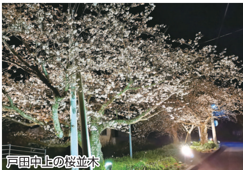
戸田中上の桜並木